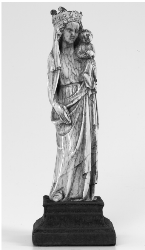
Středověká slonovinová Madona francouzské provenience z tzv. Prečanova pokladu