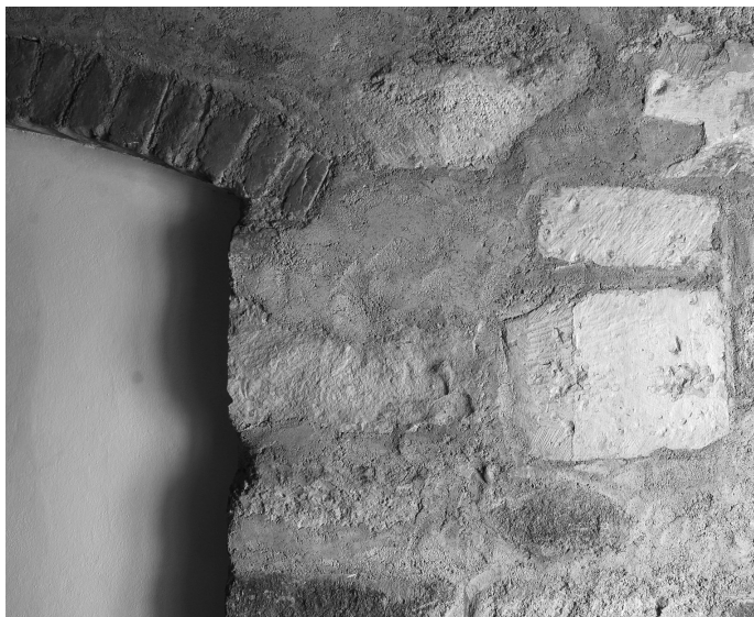
Příčka vyzděná ze spongilitových a pískovcových kvádrů ve 2. patře domu.