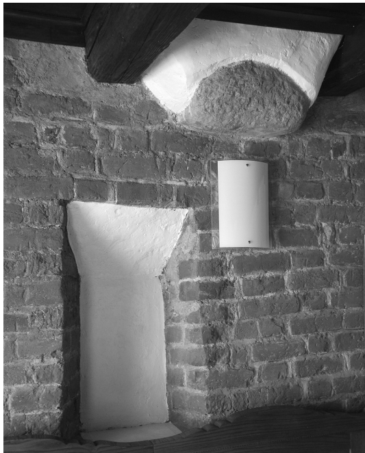
Okno střílnového tvaru v 1. patře domu.